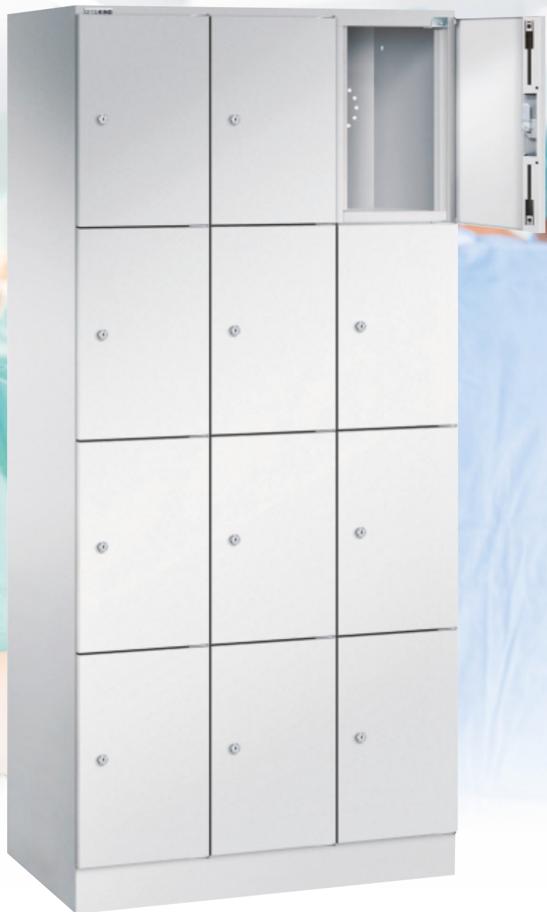
Schließfachschrank (Seite 5)